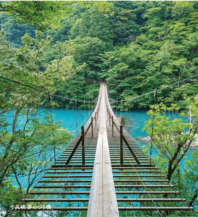
寸又峡 夢のつり橋

Jihian - ときを紡ぐ - Social welfare corporation