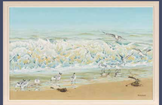
九重荘/第二九重荘 絵画掲示 [Sanderling] 西村 幸近様 作