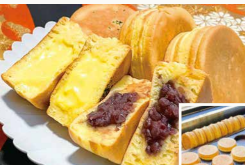
あんこ・クリームの2種ともに1つ160円

📍浜松市中区中沢町67-12 ☎053-522-8789 🕒Lunch 11:00~14:00 / Dinner 17:00~22:00 📅日・月