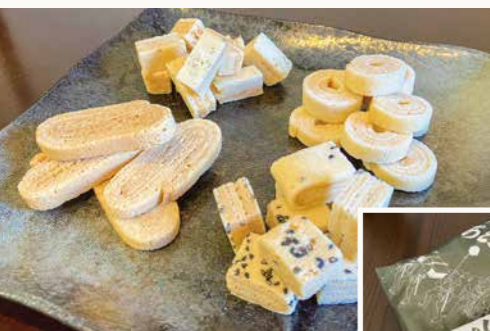
左上:海苔煎餅 左下:落花煎餅 右上:生姜煎餅 右下:胡麻煎餅

📍浜松市北区根洗町103-1 ☎053-436-0748 🕒10:00~17:00頃(売り切れ次第終了) 📅毎週日・月(6月最終土曜日~9月下旬ごろまでは休み) 予約可能(土曜日は不可)