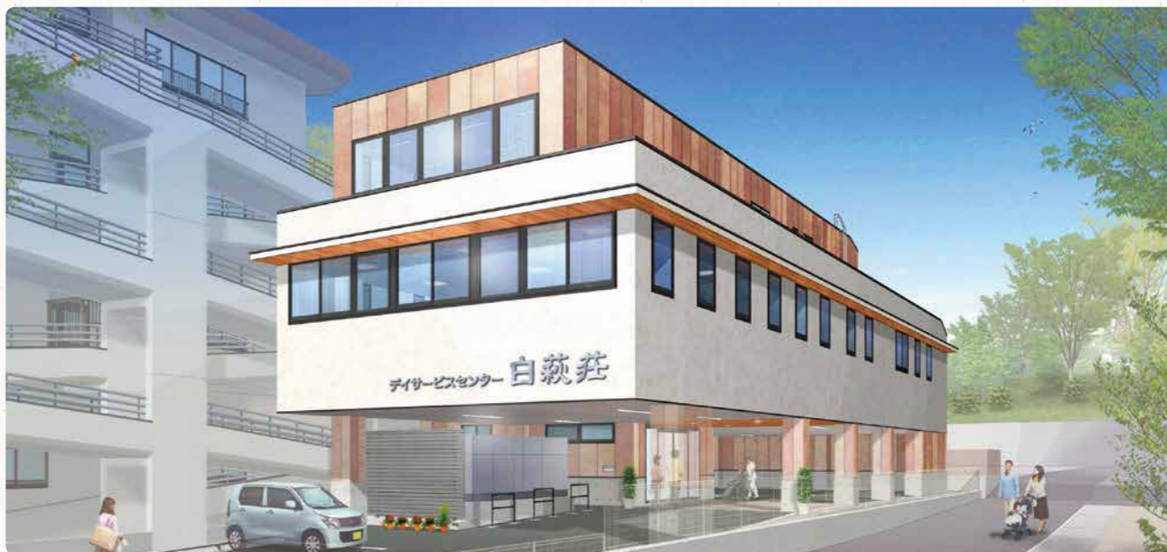
令和6年夏完成予定 デイサービスセンター白萩荘

重に進めてまいります。地域の皆様方をはじめ、ご利用者やご家族に安心してご利用頂ける施設になるよう、職員一丸となって準備を進めておりますので、ご理解ご協力の程をよろしくお願い申し上げます。また、当法人では、派遣・人材紹介会社より職員派遣や紹介を受けるなど、あらゆる方法で介護人材の確保を行い、昨年度に引き続き、外国人介護人材の受け入れも積極的に行っております。新しい年を迎え、気持ちを新たに全職員が結束して、ご利用者やご家族をはじめ関係者の皆様方から愛され喜ばれるような施設運営により一層取り組んでまいりますので、相変わらぬご厚情並びにご指導ご鞭撻を賜りますよう何卒よろしくお願い申し上げます。この一年が皆様方にとりまして、有意義な年となりますよう心より祈念申し上げ年頭のご挨拶とさせていただきます。