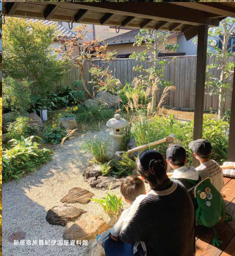
新居宿旅籠紀伊国屋資料館